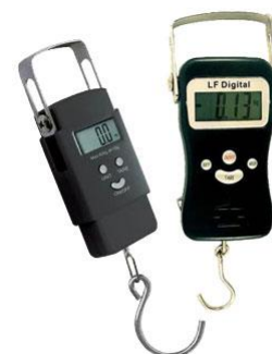
ES till vänster LF till höger