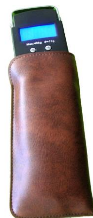
I ett glasögonfodral...